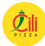
Cili Pizza 60