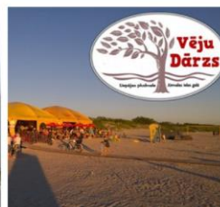
Vēju darzs 80