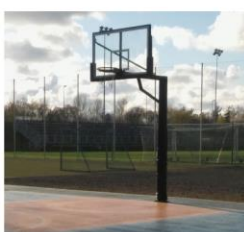
KP6 laukums 45