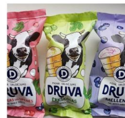
Druvas saldējums 70