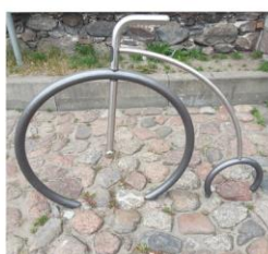
Liepājas velostativs 55