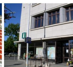
Liepājas tūrisma informācijas birojs 50