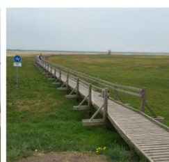
Putnu vērošanas laipa 50