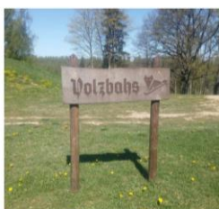
Vaiņode Volzbahs 165

Tiek ņemti vērā braucieni: sporta velobraukšana (Cycling sport); velobraukšana kā transports (Cycling transport) un kalnu ritenbraukšana (Mountain biking) kategorijās.