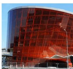
Liepājas dzintars 40