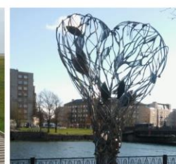
Mīlestības koks 35