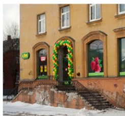
Elvi Trepītes 50