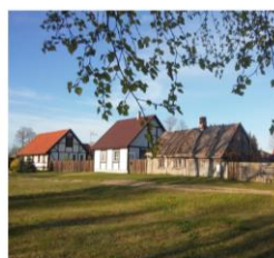
Pāvilsta zvejnieku nams 90