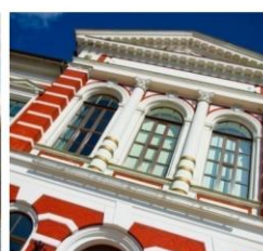
Liepājas pilsētas dome 60