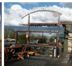
Makšķernieku nams 50