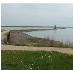
Ezera laipa 55